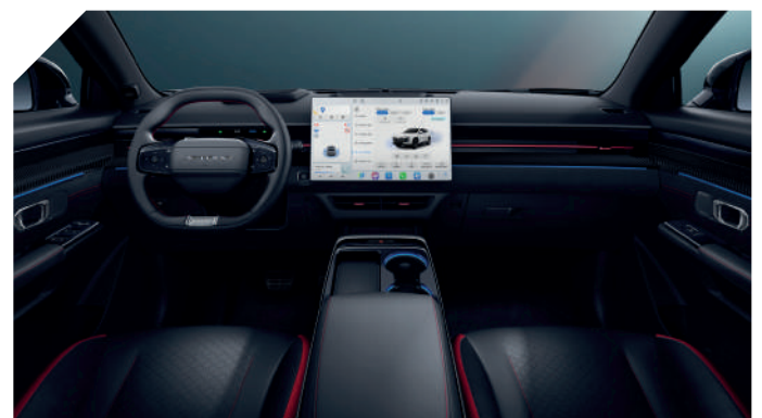
BLACK & RED