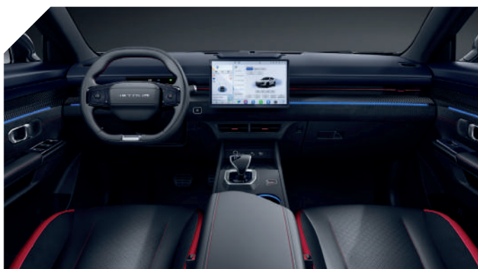
BLACK & RED